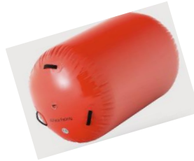
AirTrackmatte / Rolle- Akrobatik