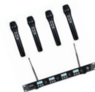
Musik – Mikrofone